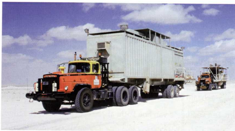
Konvooi met olieboorinstallaties op weg naar de olievelden